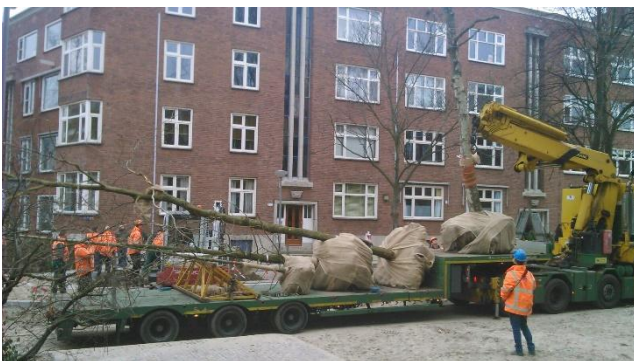
aanvoer bomen.

Zoals u wellicht gezien hebt, verloopt het grootste deel van de werkzaamheden voorspoedig in fase 1 en 2 van de Schepenstaat. In de week van 26 maart zijn de bomen geplant in het eerste deel van de straat. Aansluitend wordt een groot deel van de bestrating aangebracht. In de week van 2 april zullen ook de planten en heesters geplant worden. Dit deel van het werk loopt ongeveer twee weken vóór op schema.