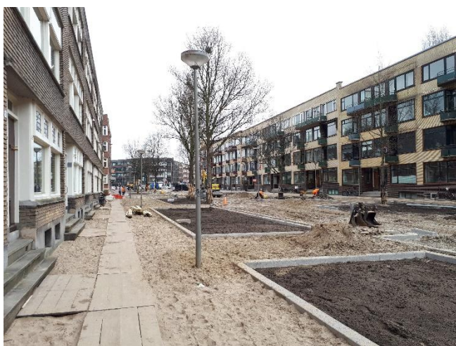
Hier komt de sleuf voor de hoogspanningskabels

sleuf nodig, die ook nog eens lang open blijft liggen omdat de kabels stuk voor stuk gelegd worden, waarna de oude kabels ook stuk voor stuk verwijderd moeten worden. Tijdens het graven van de sleuf is zorgvuldigheid geboden: de bestaande kabels en buizen moeten op hun plaats blijven liggen. Daarvoor zijn tijdelijke hulpconstructies en stutten nodig. Weliswaar worden de hoogspanningskabels met zand afgedekt nadat ze gelegd zijn, maar daarna wordt de laagspanningskabel ook vervangen en worden alle woningen opnieuw aangesloten. Daarom blijft de sleuf tot die tijd open.